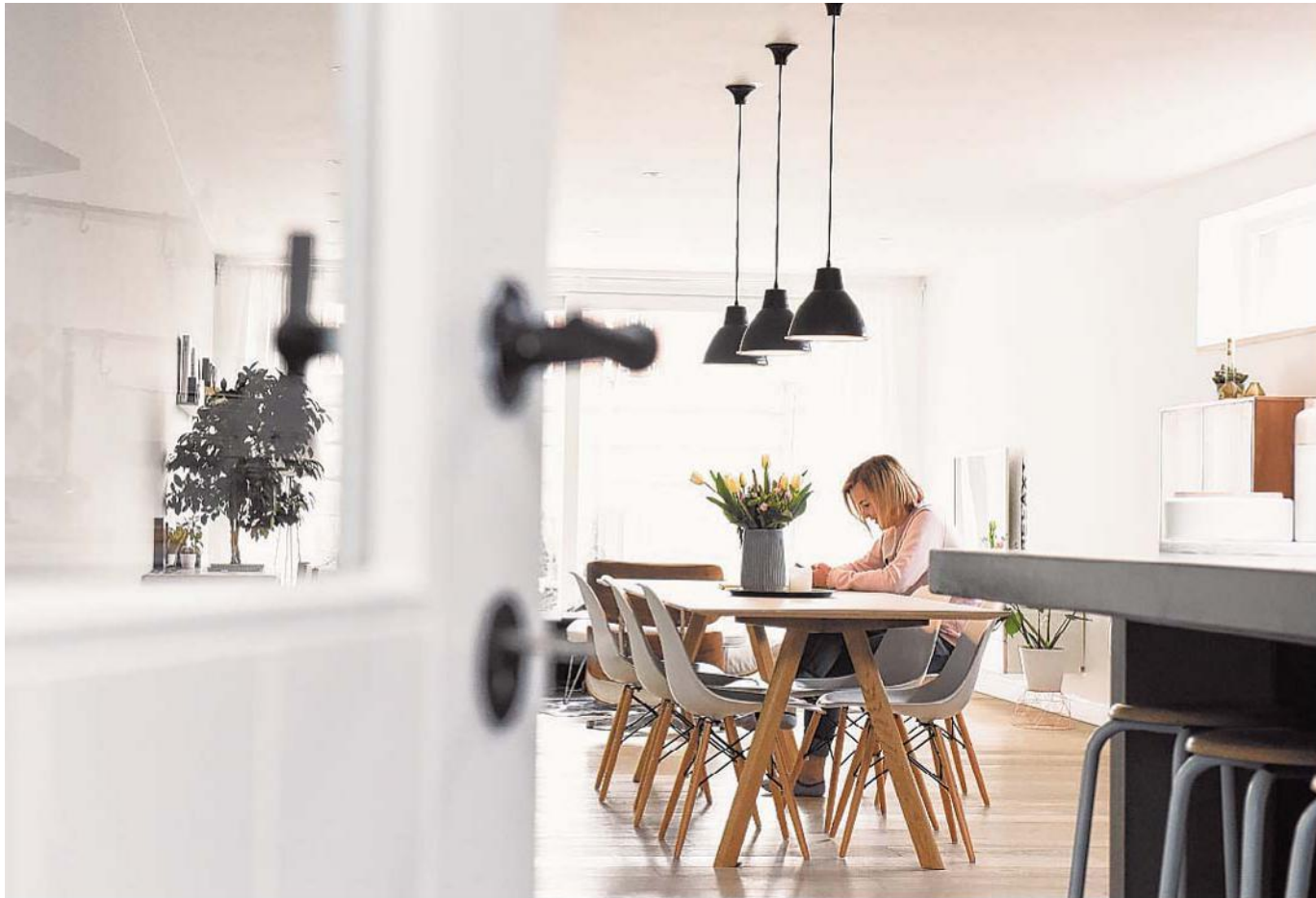
Achter de voorgevel schuilt een lange, lichte ruimte waarin keuken en woonkamer in elkaar overlopen.