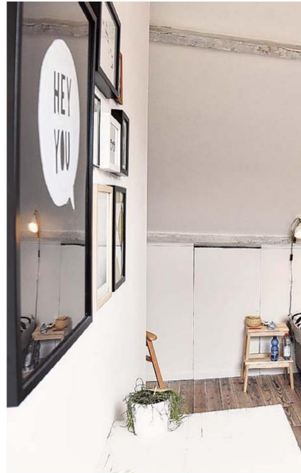
Aan de straatkant ligt het kantoor van Elwin.