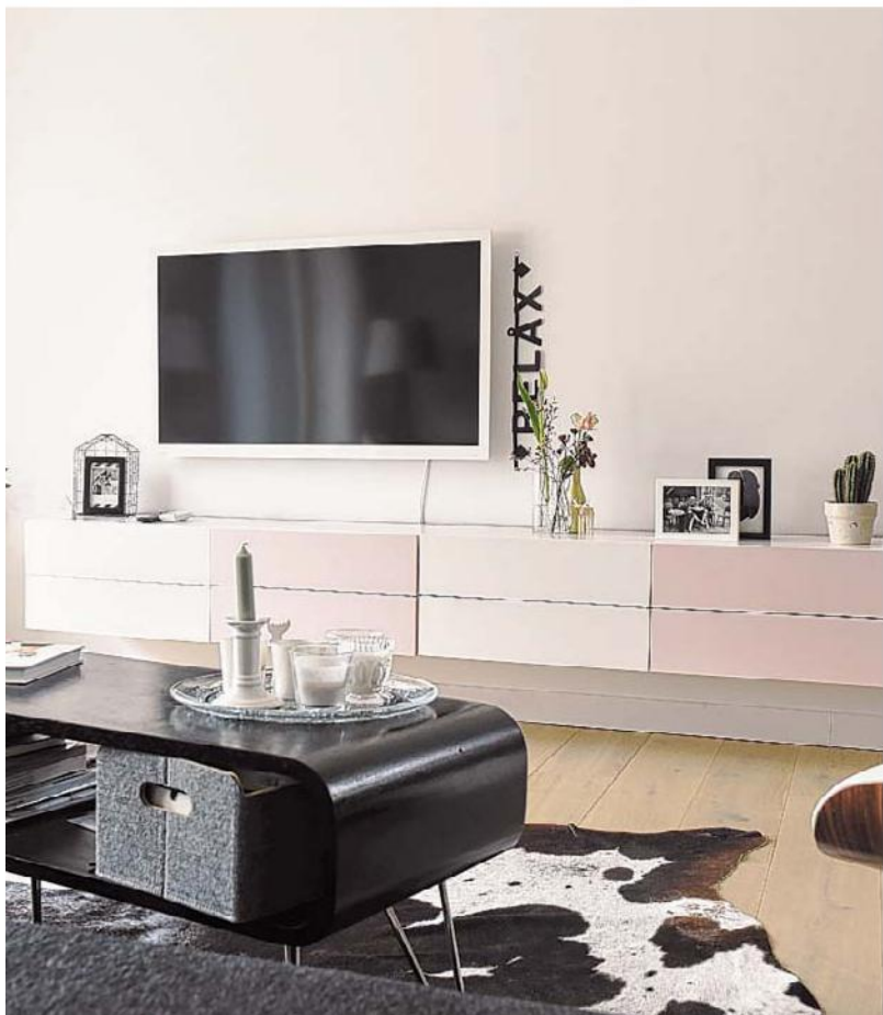
“Door te spelen met accessoires kan je per seizoen een aangepaste sfeer in huis creëren.”