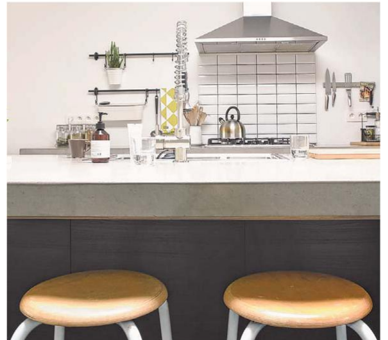
De krukjes aan het keukeneiland zijn een vintage vondst.