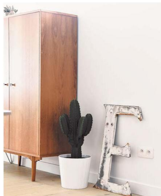
Mama's oude kleerkast heeft een plaats in de woonkamer gekregen.