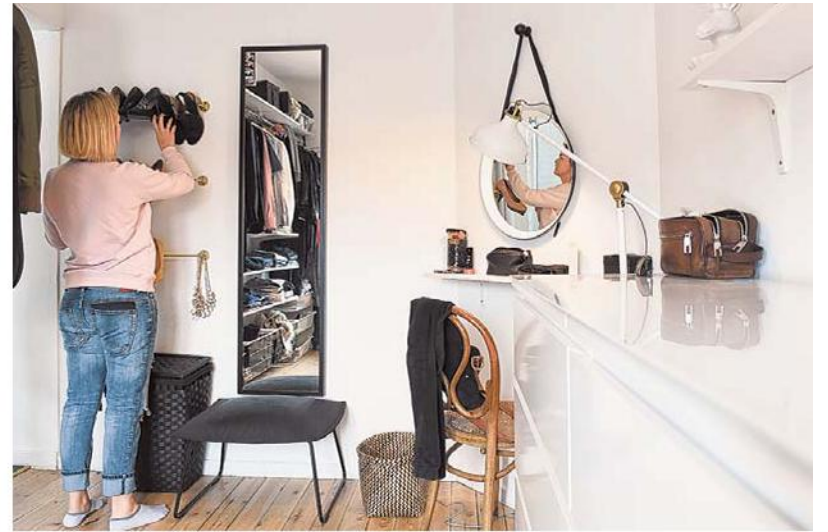
De dressing ligt aan de straatkant, net naast de badkamer.

De slaapkamer ligt in de nok van het dak, in het oorspronkelijke huis. "Toen ik even op reis was, installeerde Elwin twee dakramen en plots kreeg de kamer veel meer waarde."