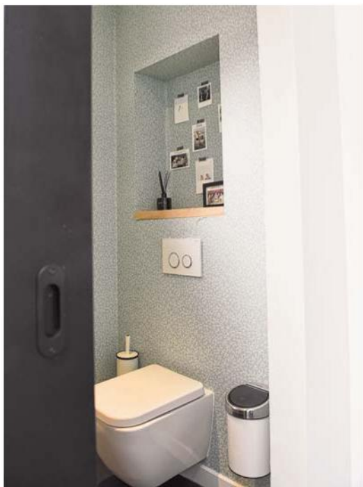
De inrichting van het kleinste kamertje mag al eens wat uit de band springen.